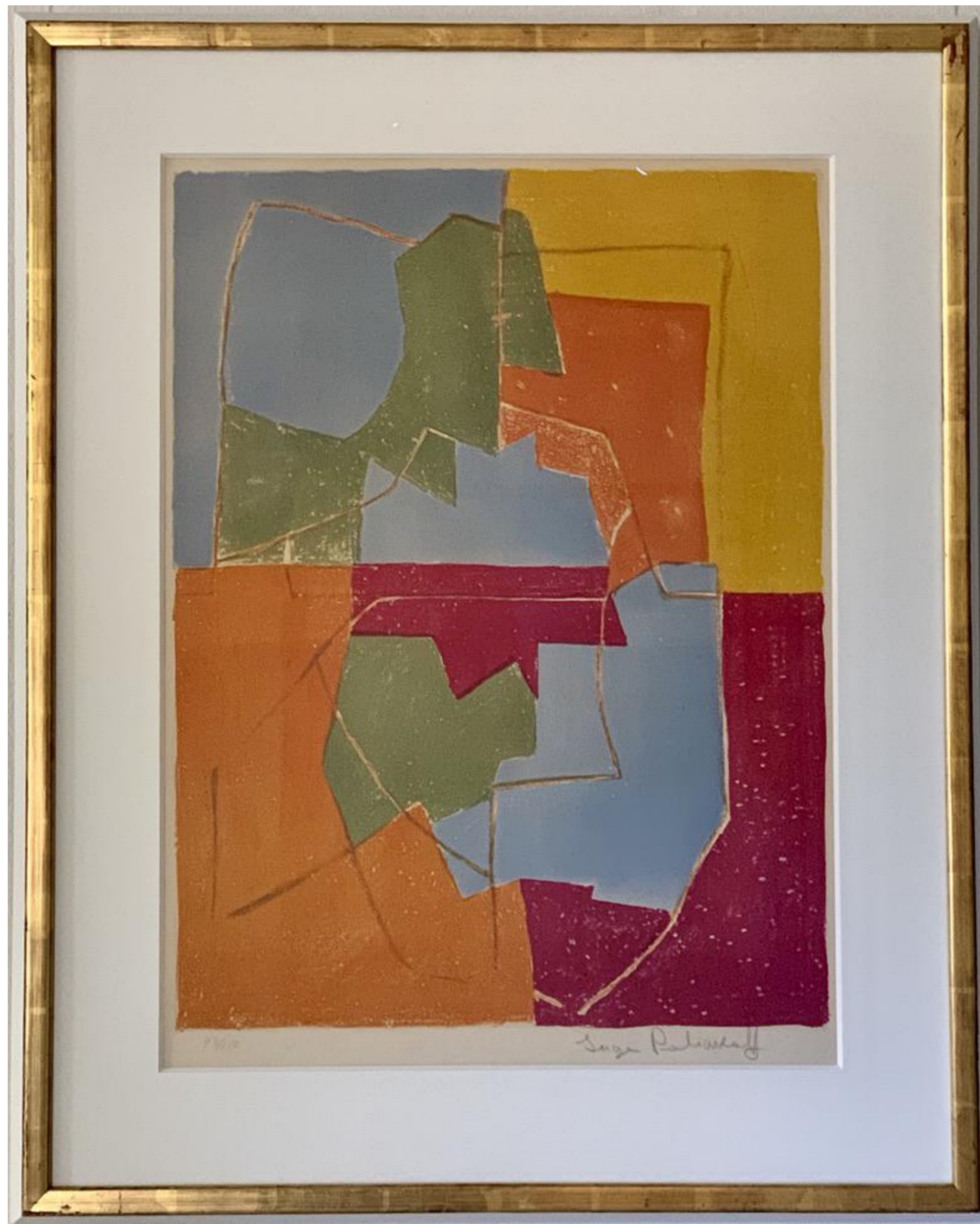
Serge Poliakoff - Komposition, o. J. Original Lithografie, 65,5 x 49,7 cm, handsigniert und nummeriert 43 / 150