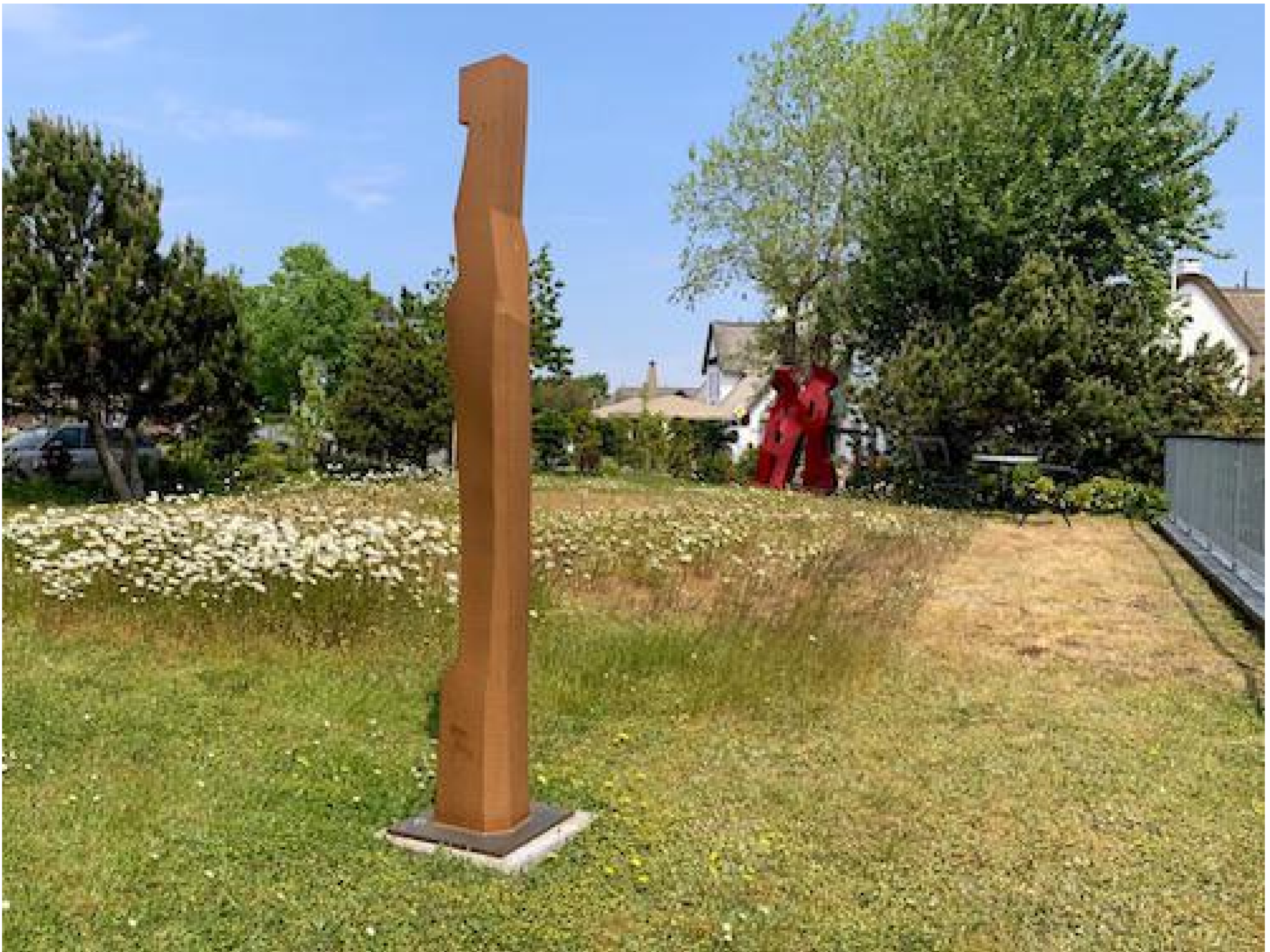
Stefan Faas - Anthropocor Constanza, 2013 Cortenstahl, Höhe 220 cm, © Stefan Faas & Galerie Falkenstern Fine Art