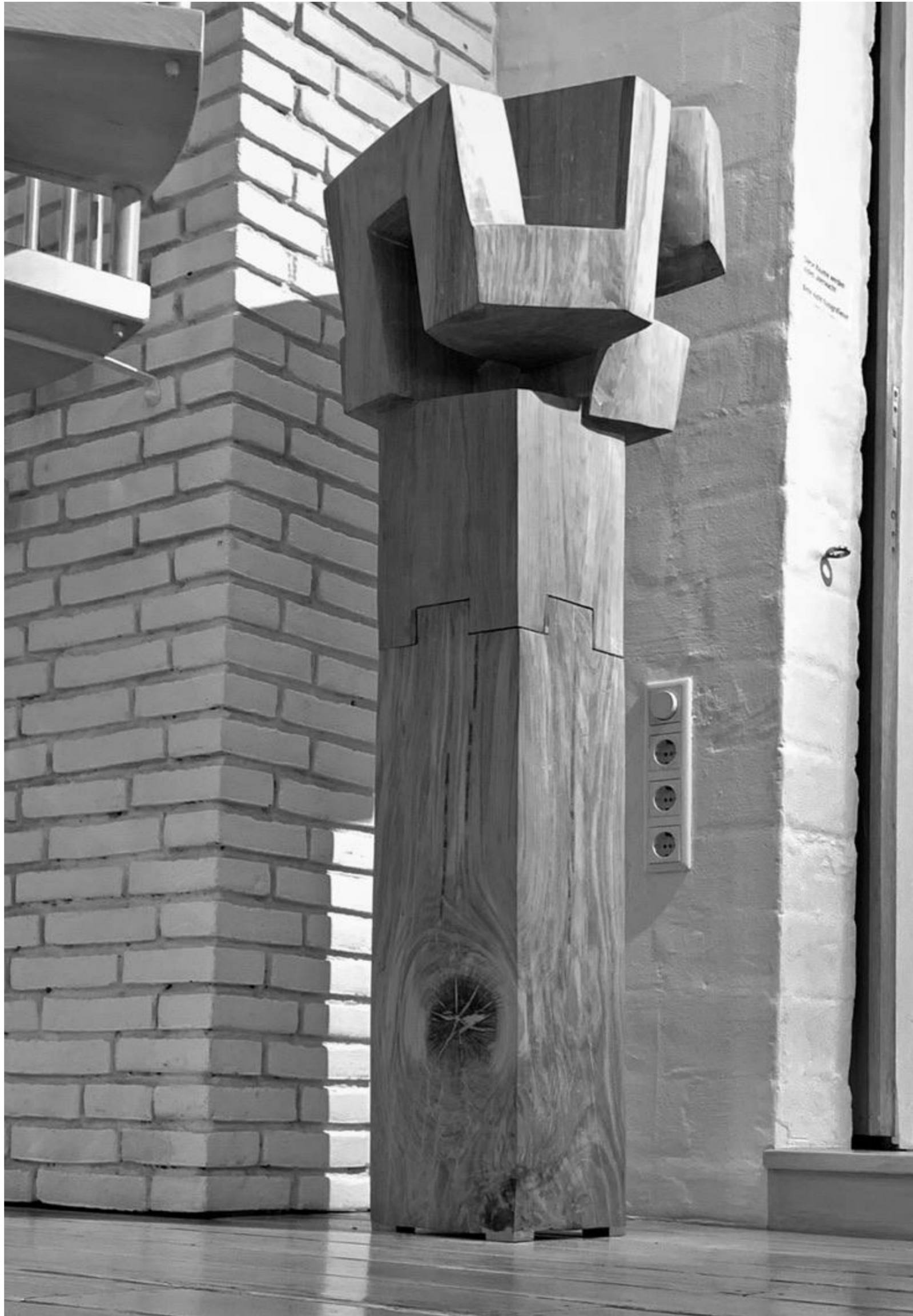
Mathias Kadolph - Poulenc, 2019 Eiche, 155 x 50 x 50 cm, © Mathias Kadolph & Galerie Falkenstern Fine Art