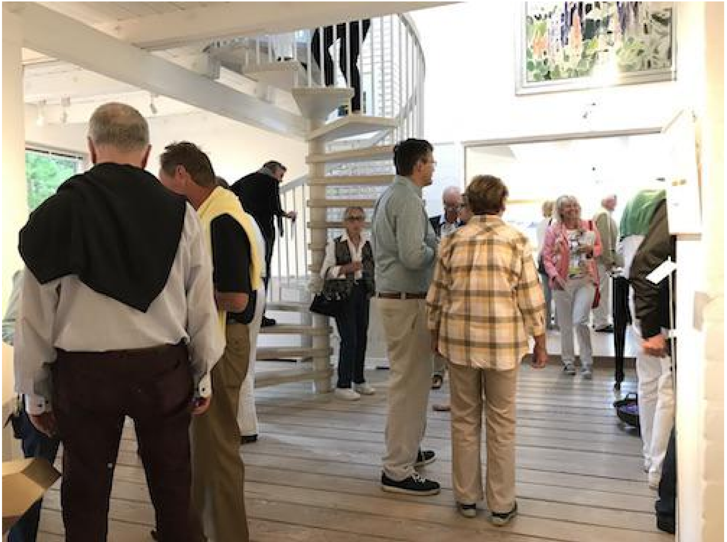
Vernissage Galerie Falkenstern Fine Art