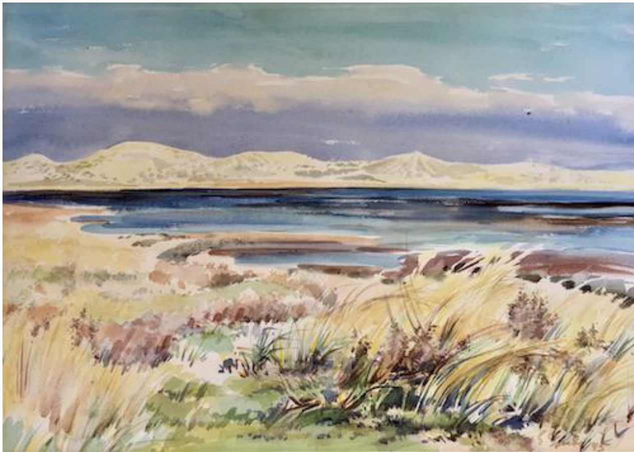
Siegward Sprotte - "Herbstsonne über dem Sylter Watt", 1945 Aquarell auf Papier, 38,5 x 53,8 cm, © Galerie Falkenstern Fine Art / Armin Sprotte