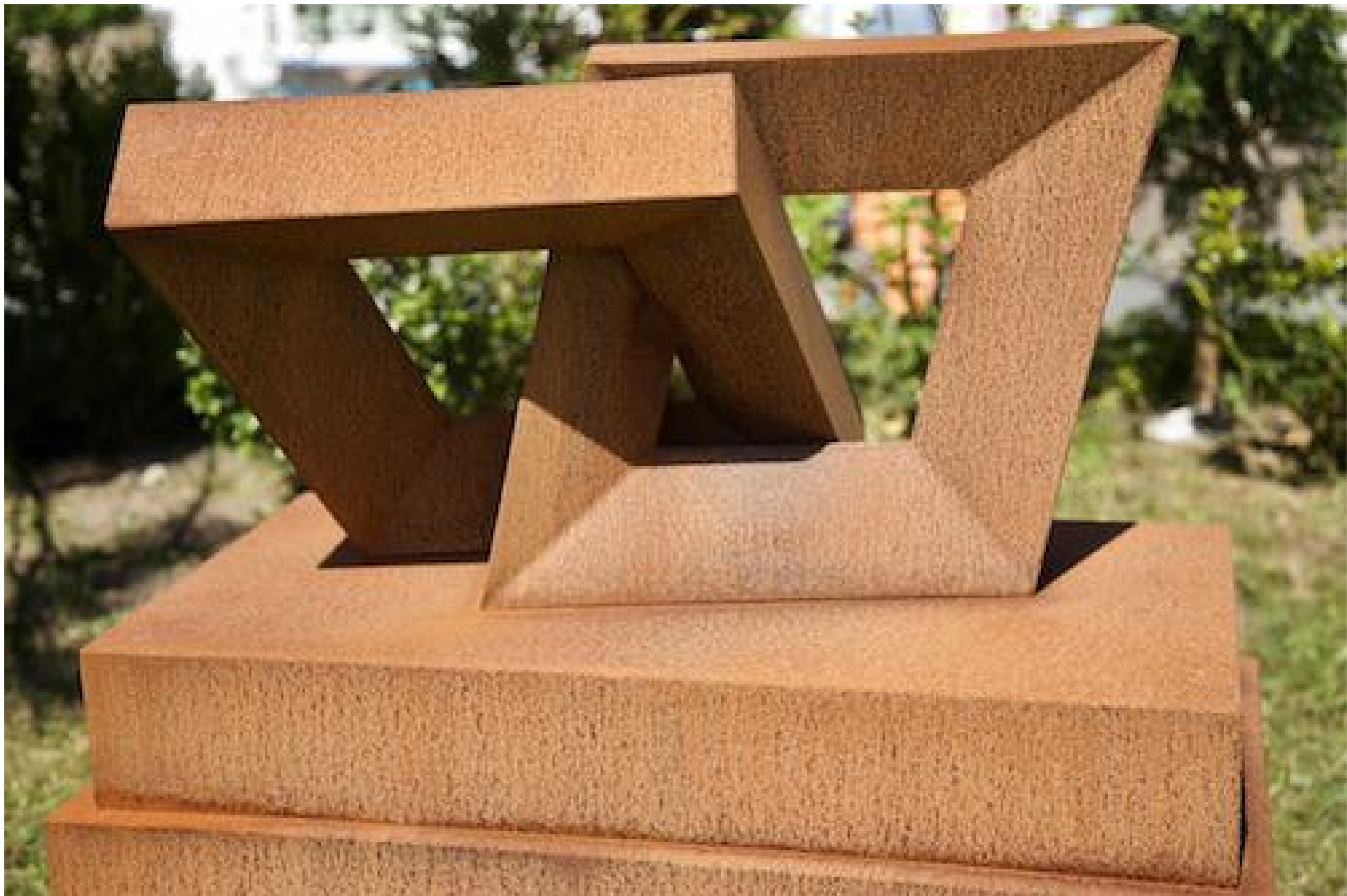
Jörg Plickat - Equilibrium II, 2015 Cortenstahl, 78 x 40 x 53 cm, © Jörg Plickat & Galerie Falkenstern Fine Art