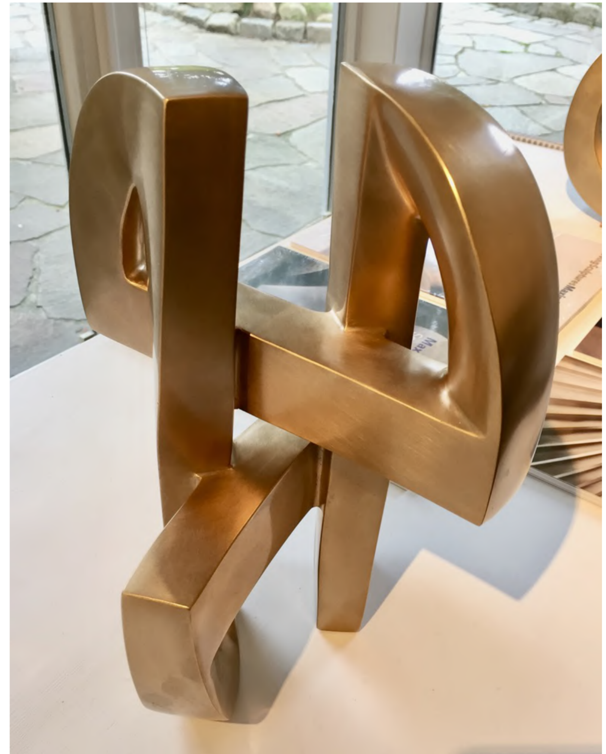
Maximilian Verhas - Insider, 2009 Bronze, Auflage 1/10, 26 x 28 x 28 cm, © Maximilian Verhas & Galerie Falkenstern Fine Art

Maximilian Verhas - Korrespond, 2009 Bronze, Edition 1/10, 30 x 27 x 23, © Maximilian Verhas & Galerie Falkenstern Fine Art