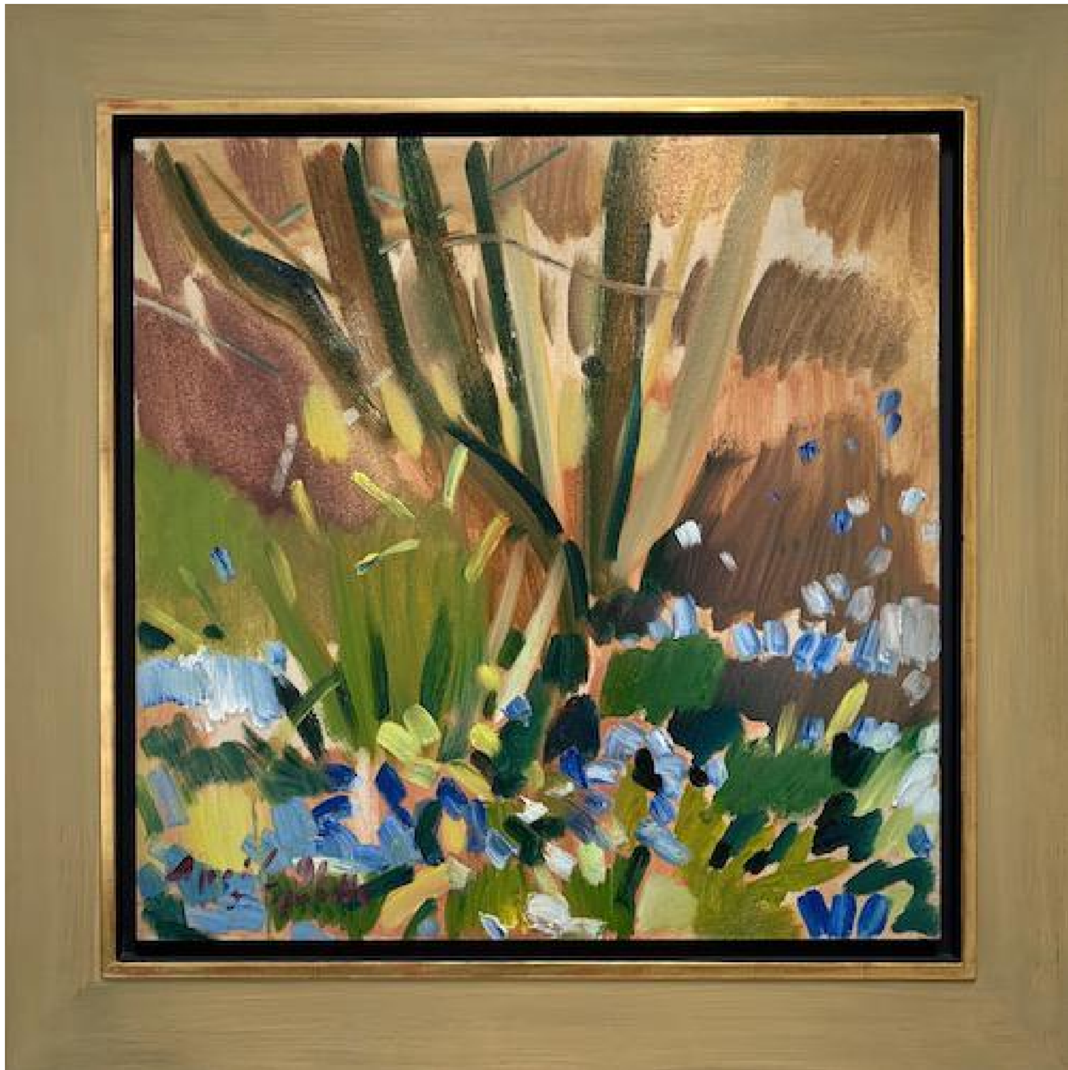
Siegward Sprotte - Für Barthold Heinrich Brockes, 1991 Öl auf Hartfaser, 61 x 61 cm