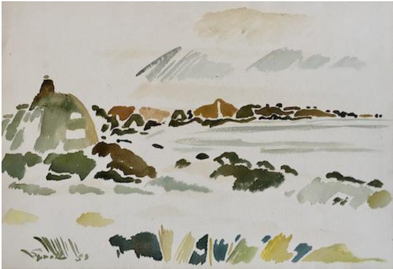
Siegward Sprotte - Häuser am Watt, 1989

Aquarell auf Bütten, 45 x 65,2 cm