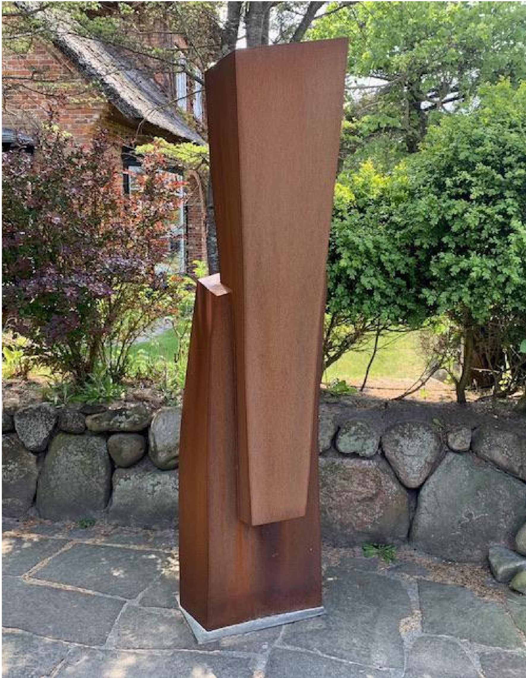
Stefan Faas - Anthropocor KEPHALOS I, 2018 Cortenstahl, Höhe 200 cm, © Stefan Faas & Galerie Falkenstern Fine Art