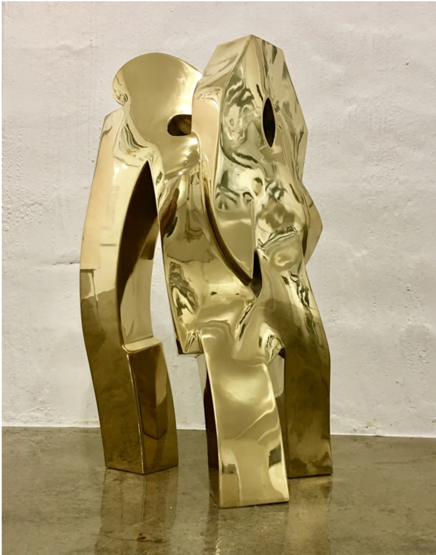
Liu Yonggang, Listen with open ears, 2009 Stahl Ti, 60 x 38 x 26 cm, © Liu Yonggang & Galerie Falkenstern Fine Art