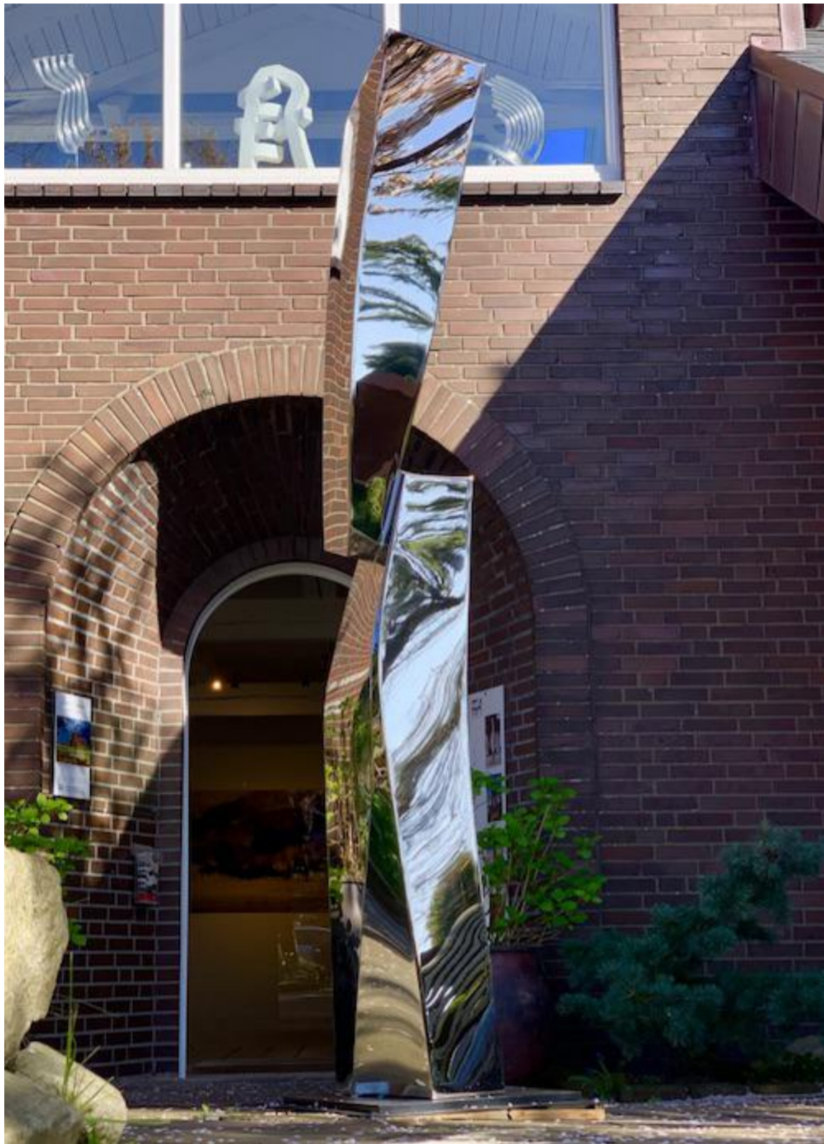
Stefan Faas - Anthropomir Kephalos II, 2019 Spiegelstahl V4a, Höhe 230 cm © Stefan Faas & Galerie Falkenstern Fine Art

Stefan Faas - Anthropomir Kephalos II, 2019 Mirror finish Steel V4a, Height 230 cm © Stefan Faas & Galerie Falkenstern Fine Art