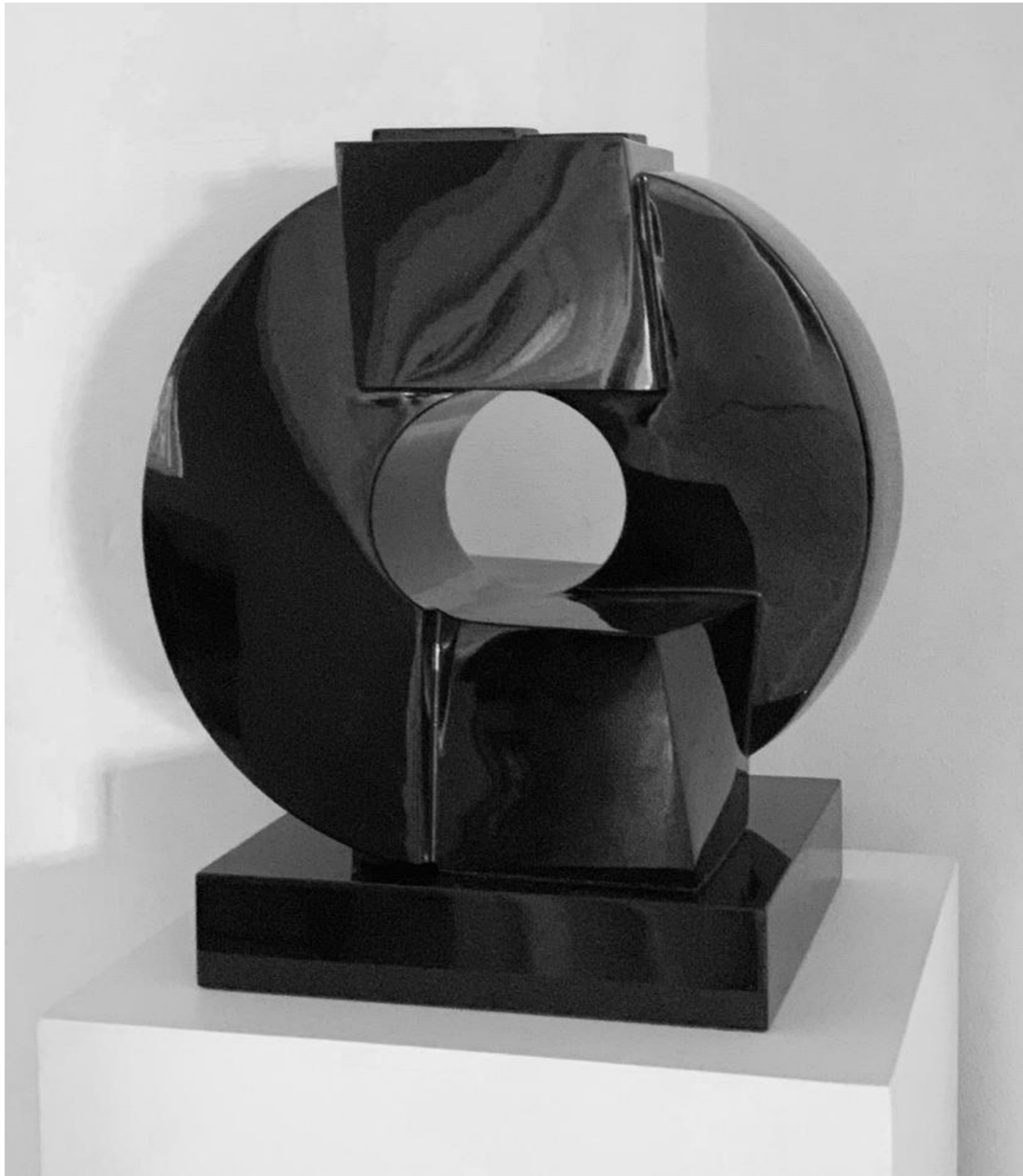
Jörg Plickat - Love Poem, 2017

Schwarzer Granit, hochglanzpoliert, 53 x 45 x 35 cm, © Jörg Plickat & Galerie Falkenstern Fine Art