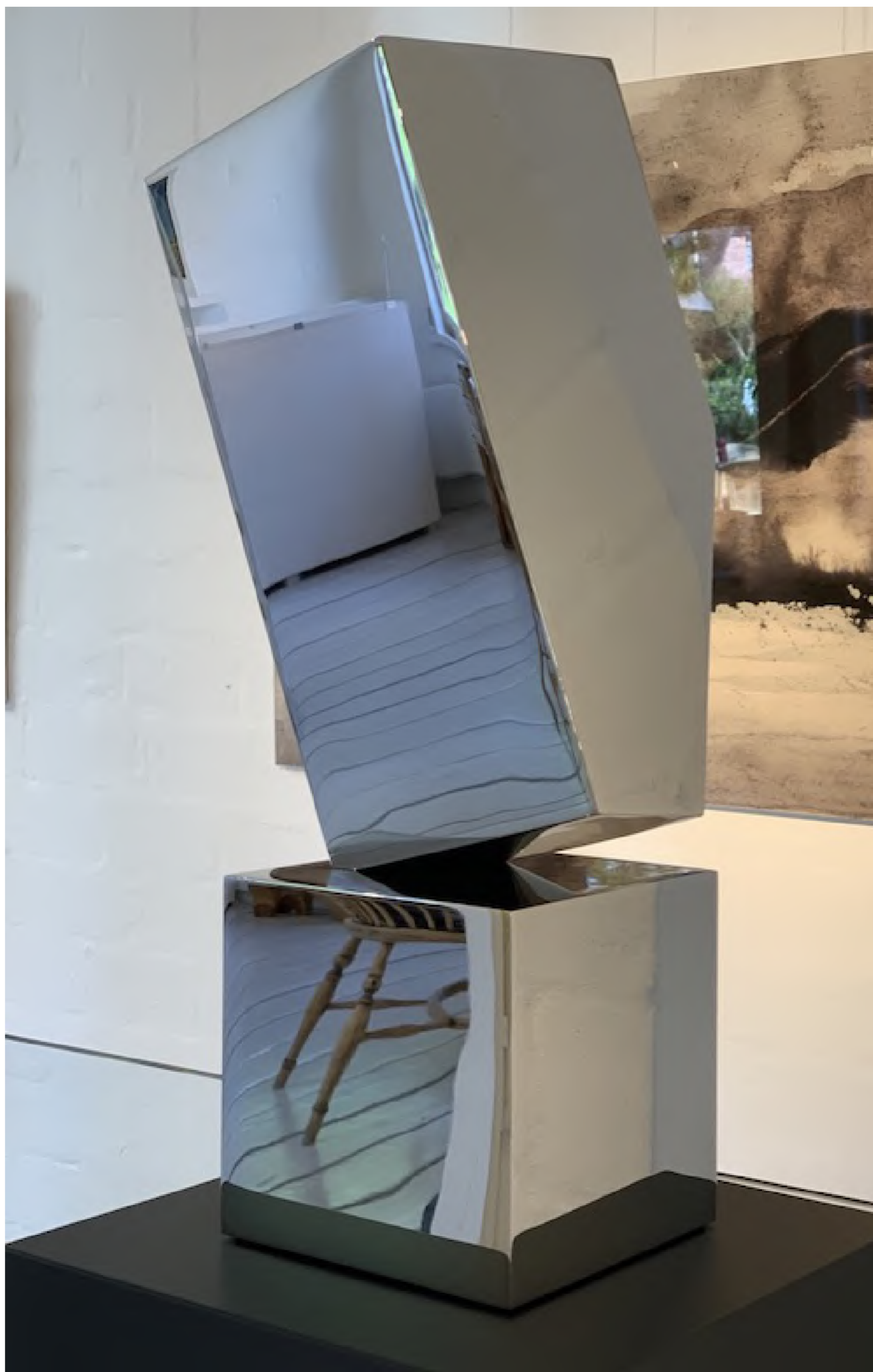
Stefan Faas - Anthropomir Testa XX-V, 2019 Spiegelstahl, Höhe 55 cm, © Stefan Faas & Galerie Falkenstern Fine Art