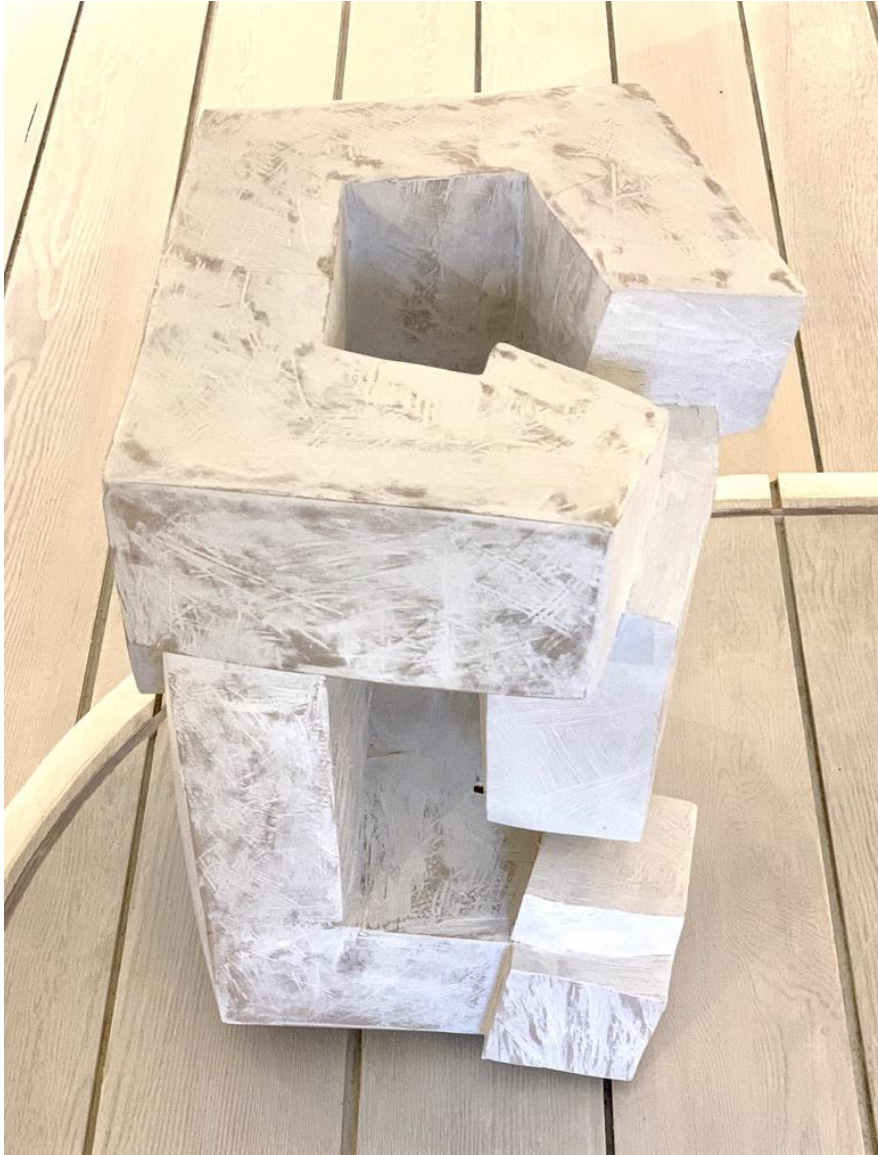
Mathias Kadolph - Brioso, 2014

Platane, weiß gefasst, 63 x 45 x 42 cm, © Mathias Kadolph & Galerie Falkenstern Fine Art