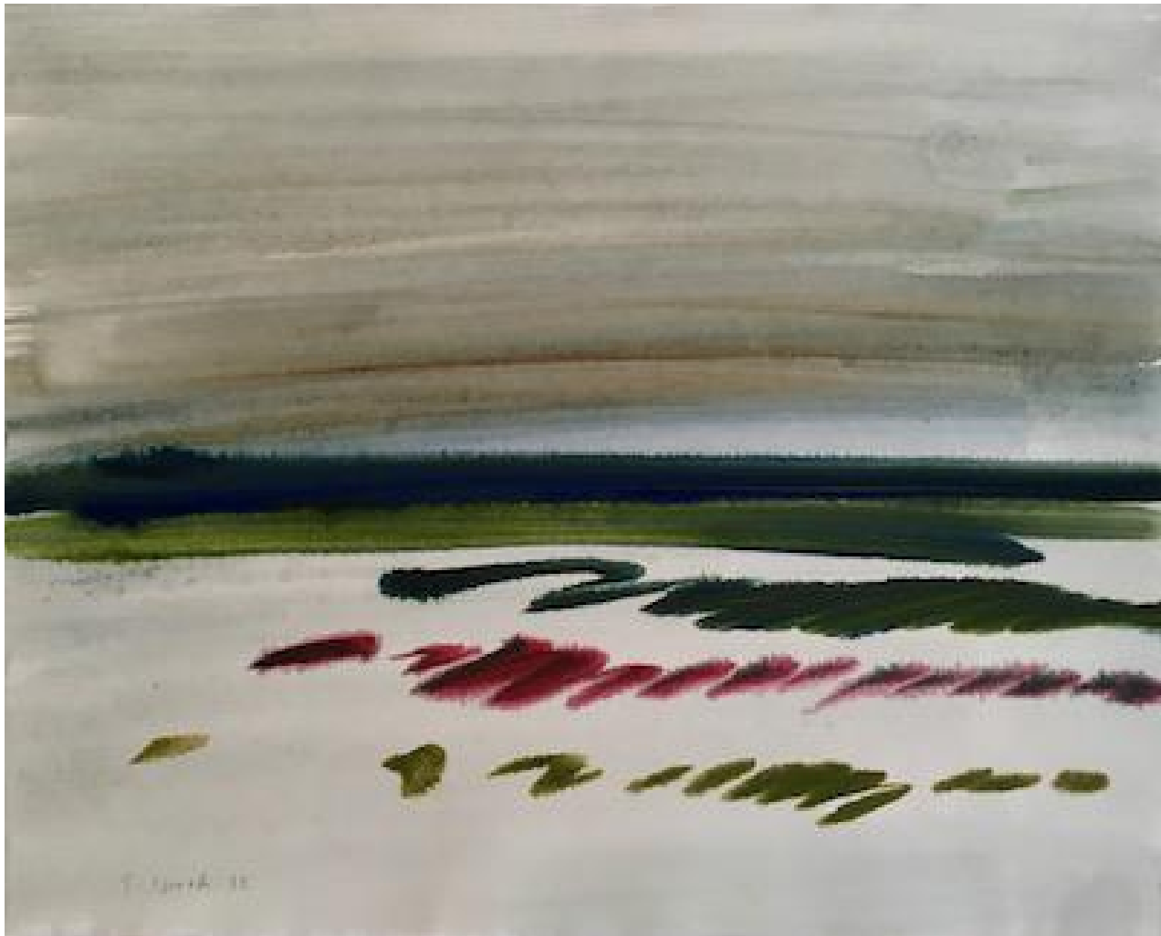
Siegward Sprotte - Beginnender Tag, 1992 Gouache auf Bütten, 52 x 64,9 cm, © Galerie Falkenstern Fine Art / Armin Sprotte