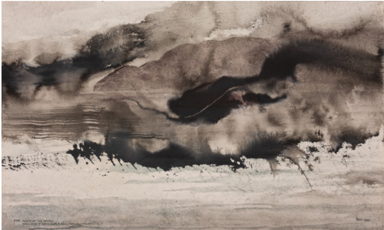
Satish Gupta - Dance of the brush, 2018

96,8 x 161,46 cm, C-print, Auflage: 40, 96,8 x 161,46 cm, © Satish Gupta & Galerie Falkenstein Fine Art