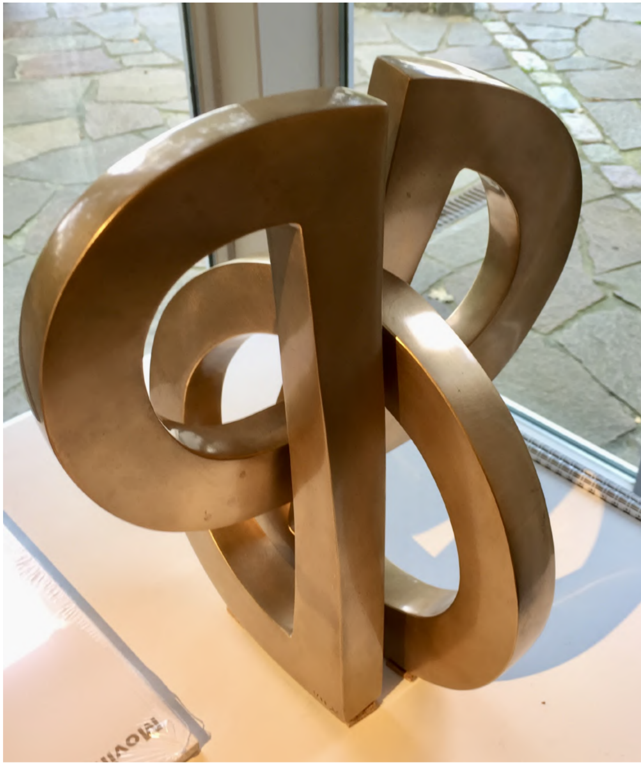
Maximilian Verhas - Korrespond, 2009 Bronze, Auflage 1/10, 30 x 27 x 23, © Maximilian Verhas & Galerie Falkenstern Fine Art

Maximilian Verhas - Korrespond, 2009 Bronze, Edition 1/10, 30 x 27 x 23, © Maximilian Verhas & Galerie Falkenstern Fine Art