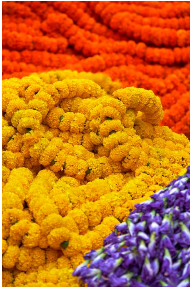
Dinesh Khanna - Kolkata April 19th I, 2019 C-Print, Auflage 40, © Dinesh Khanna & Galerie Falkenstern Fine Art