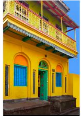
Dinesh Khanna - Kolkata, 8 Buildings, 2019 C-Print, Auflage 40, © Dinesh Khanna & Galerie Falkenstern Fine Art