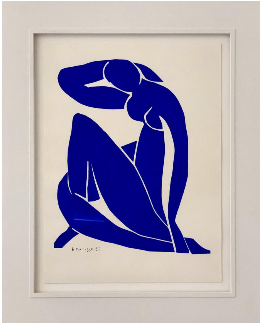
Henri Matisse - Nu Bleu II, 1952 Offsetlitho, 59 x 45 cm, © Galerie Falkenstern Fine Art / Armin Sprotte

Henri Matisse - Nu Bleu II, 1952 Offset litho, 59 x 45 cm, © Galerie Falkenstern Fine Art / Armin Sprotte