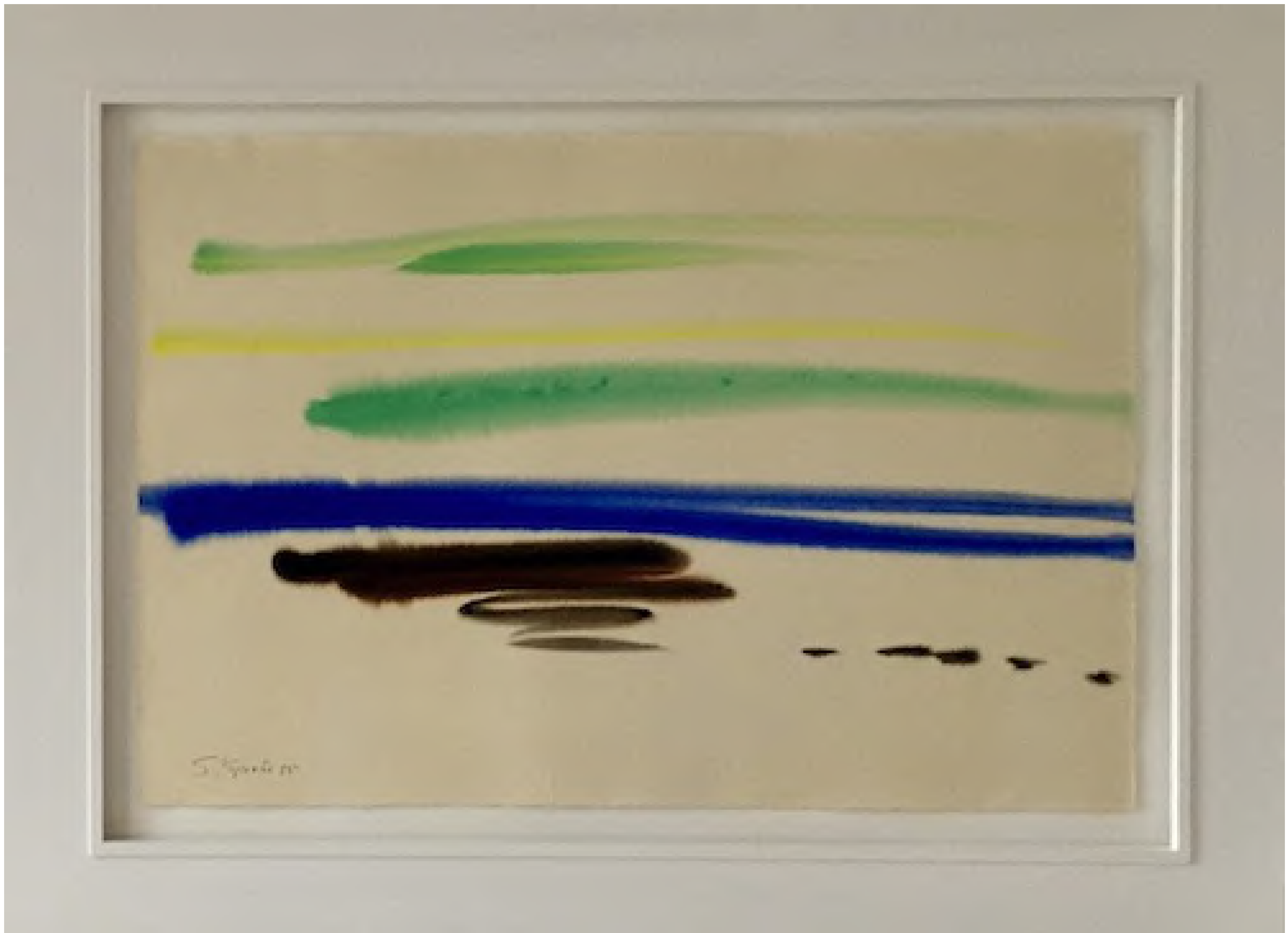
Siegward Sprotte - Horizont I, 1985 Gouache auf Arches, 53,5 x 79 cm, © Galerie Falkenstern Fine Art / Armin Sprotte