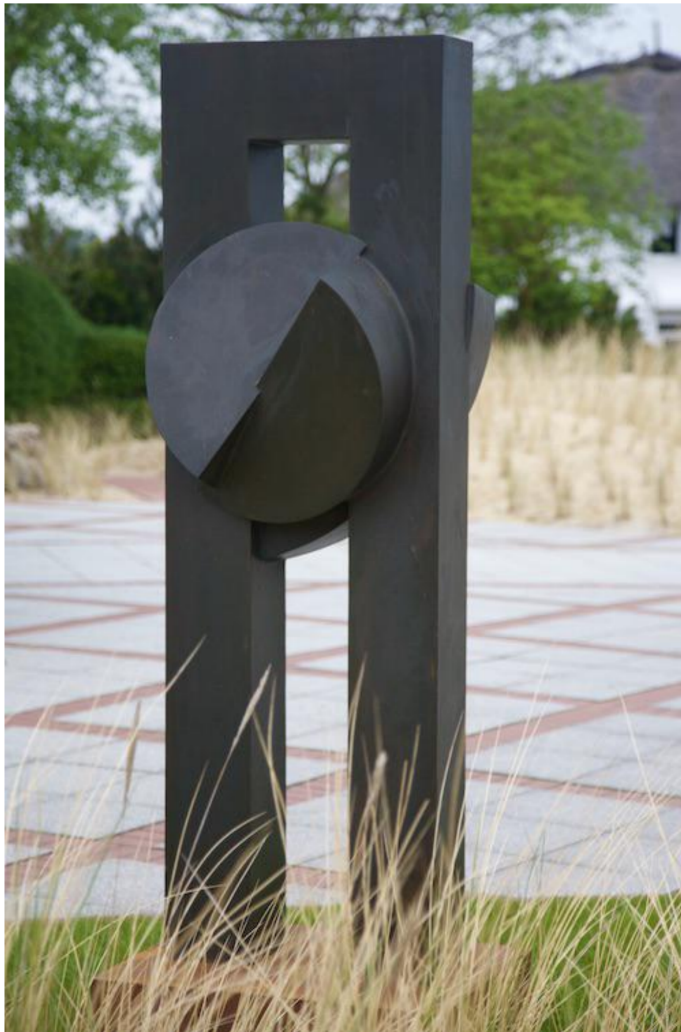
Jörg Plickat - Movimento, 2007 Bronzeunikat auf Cortenstahl, 230 x 80 x 60 cm © Jörg Plickat & Galerie Falkenstern Fine Art