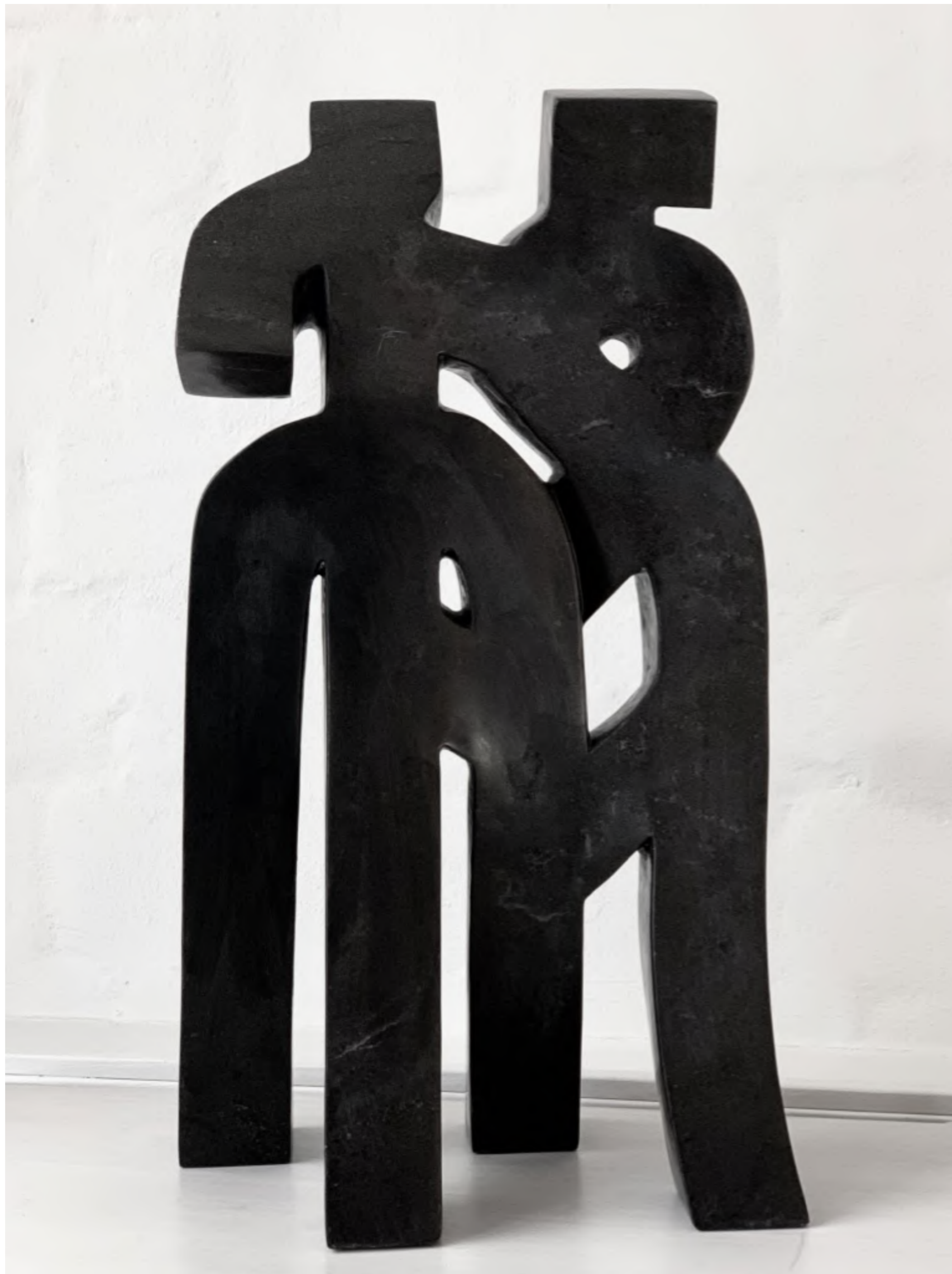
Liu Yonggang - Ai Yong, 2007 Mexikanische Jade, 56 x 31 x 18 cm, © Liu Yonggang & Galerie Falkenstern Fine Art