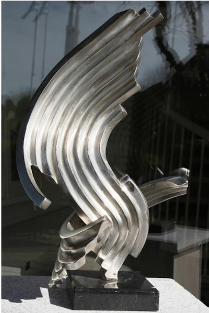
Volkmar Haase - Gegenläufige Woge, 1993 Edelstahl Unikat, Höhe 55 cm © Volkmar Haase & Galerie Falkenstern Fine Art