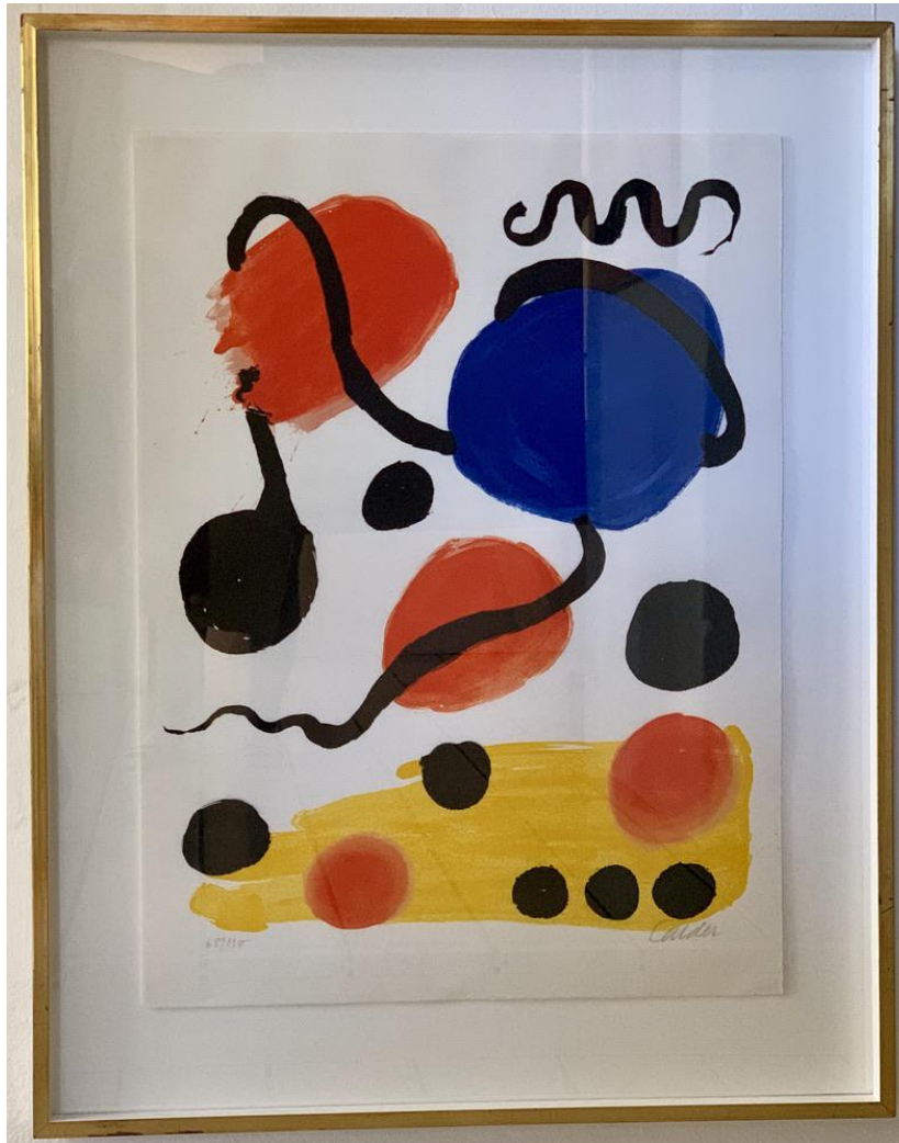
Alexander Calder - o. T., o. J. Farblithographie - 73,8 x 54,8 cm, 7120/4, handsigniert und nummeriert 68 / 130 (leichte Spiegelung im Glas), © Galerie Falkenstern Fine Art / Armin Sprotte

Alexander Calder - Untitled, Undated Colour lithograph - 73,8 x 54,8 cm, 7120/4, signed and numbered 68 / 130 (slight reflection in the glass), © Galerie Falkenstern Fine Art / Armin Sprotte