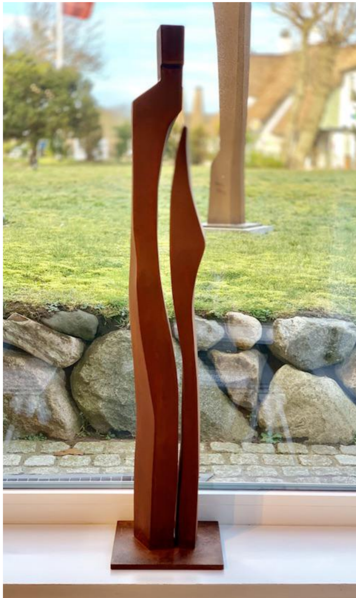
Stefan Faas, Anthropocor Durand II, 2018 Cortenstahl, Höhe 100 cm, © Stefan Faas & Galerie Falkenstern Fine Art