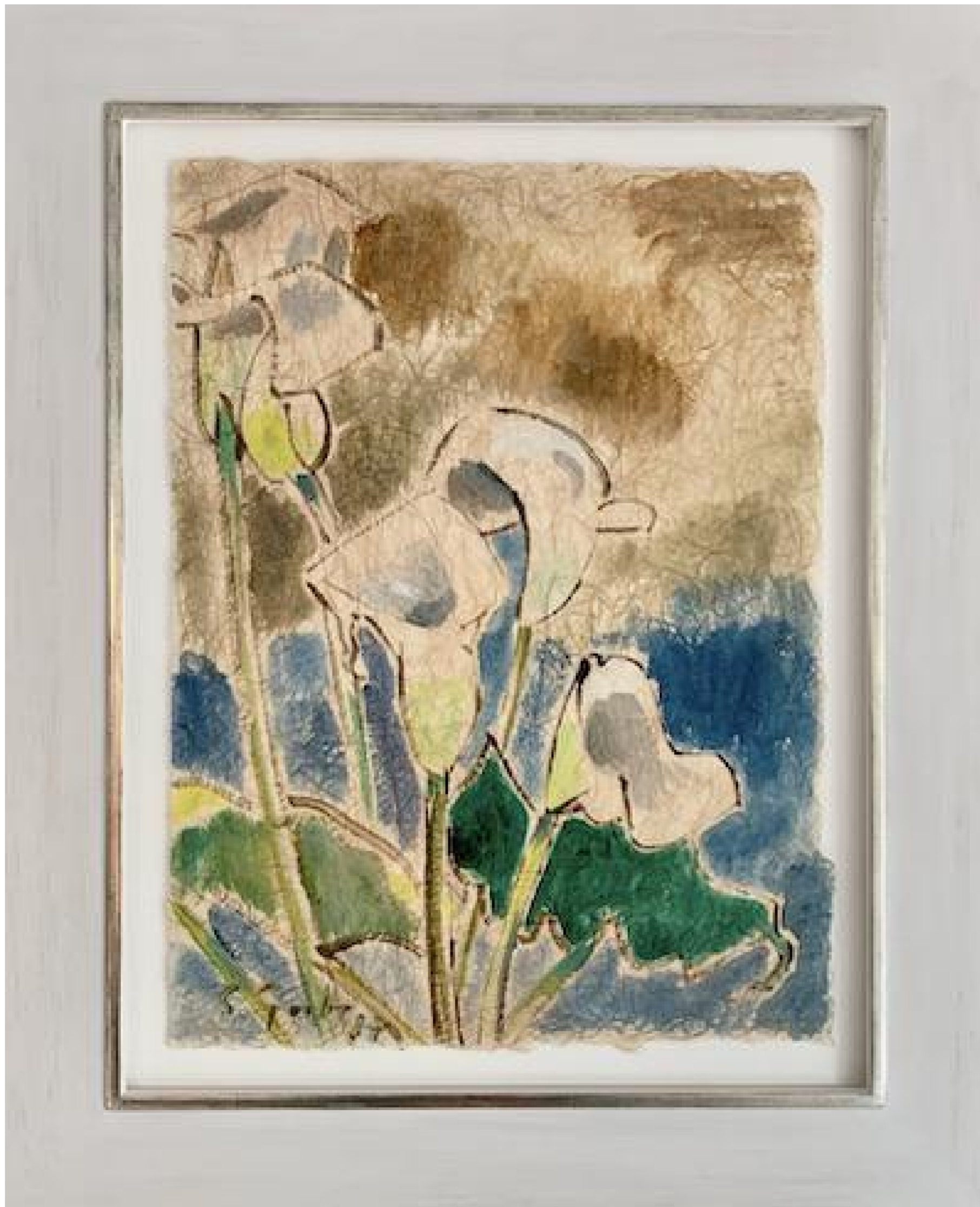
Siegward Sprotte - Anthurien, 1987 Aquarell auf Japan, 62 x 47 cm, © Galerie Falkenstern Fine Art / Armin Sprotte