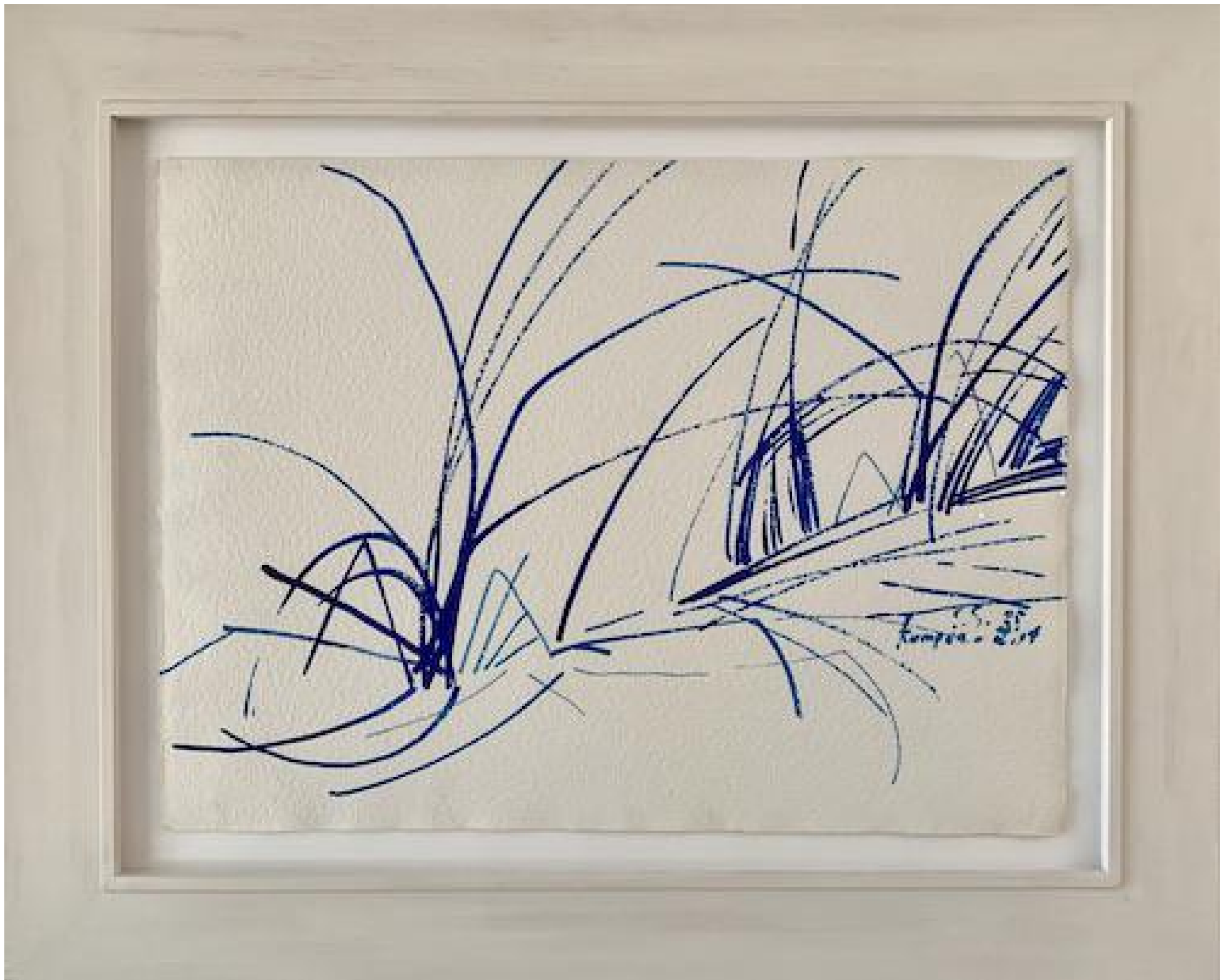
Siegward Sprotte - Blaue Halme, Kampen - List, 1985

Blaue Tinte auf Bütten, 50,7 x 68,5 cm, © Galerie Falkenstern Fine Art / Armin Sprotte