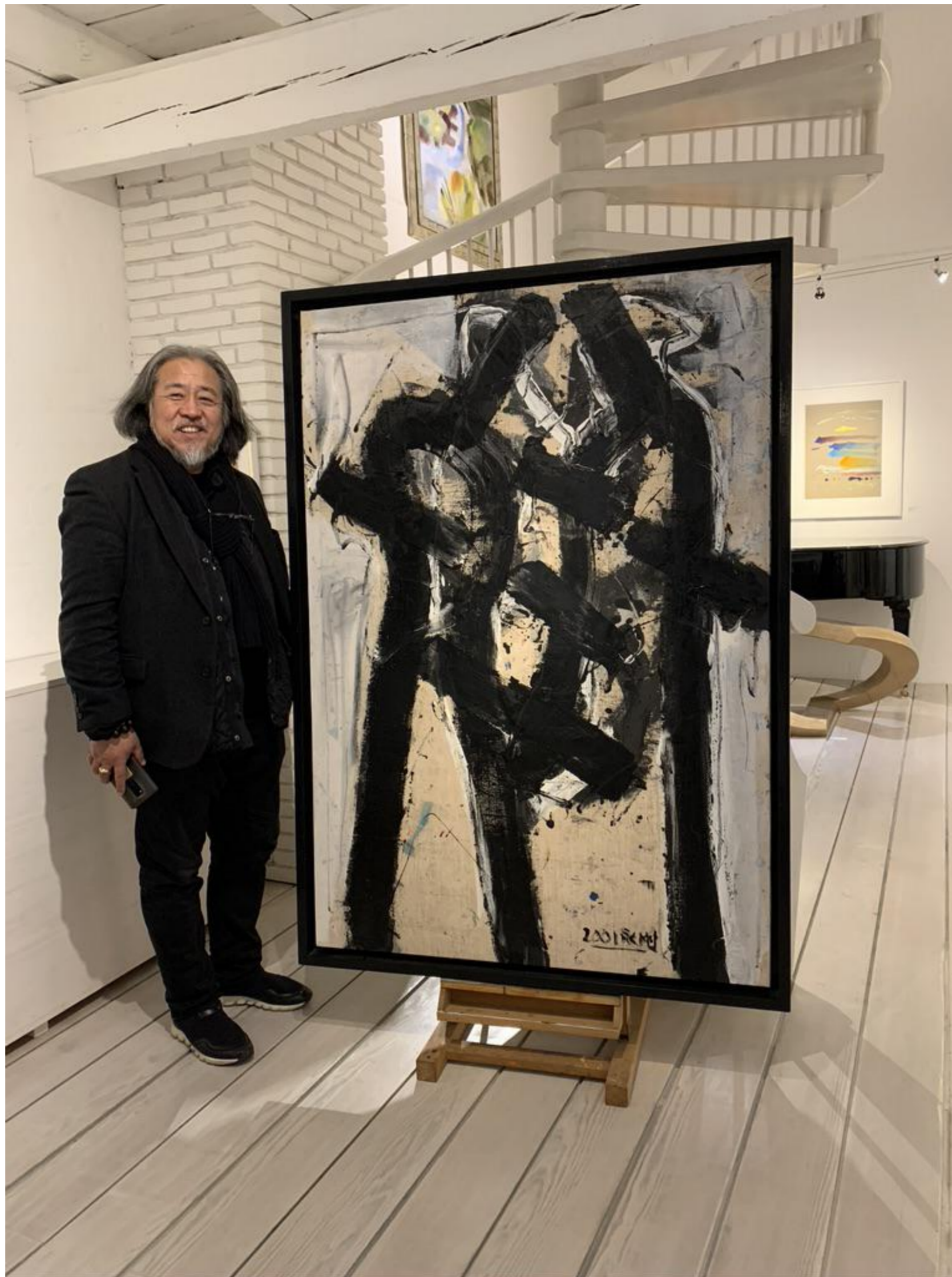
Liu Yonggang: Ai Yong (Series Seven), 2001 Öl auf Leinwand, 163 x 115 cm, © Liu Yonggang & Galerie Falkenstern Fine Art