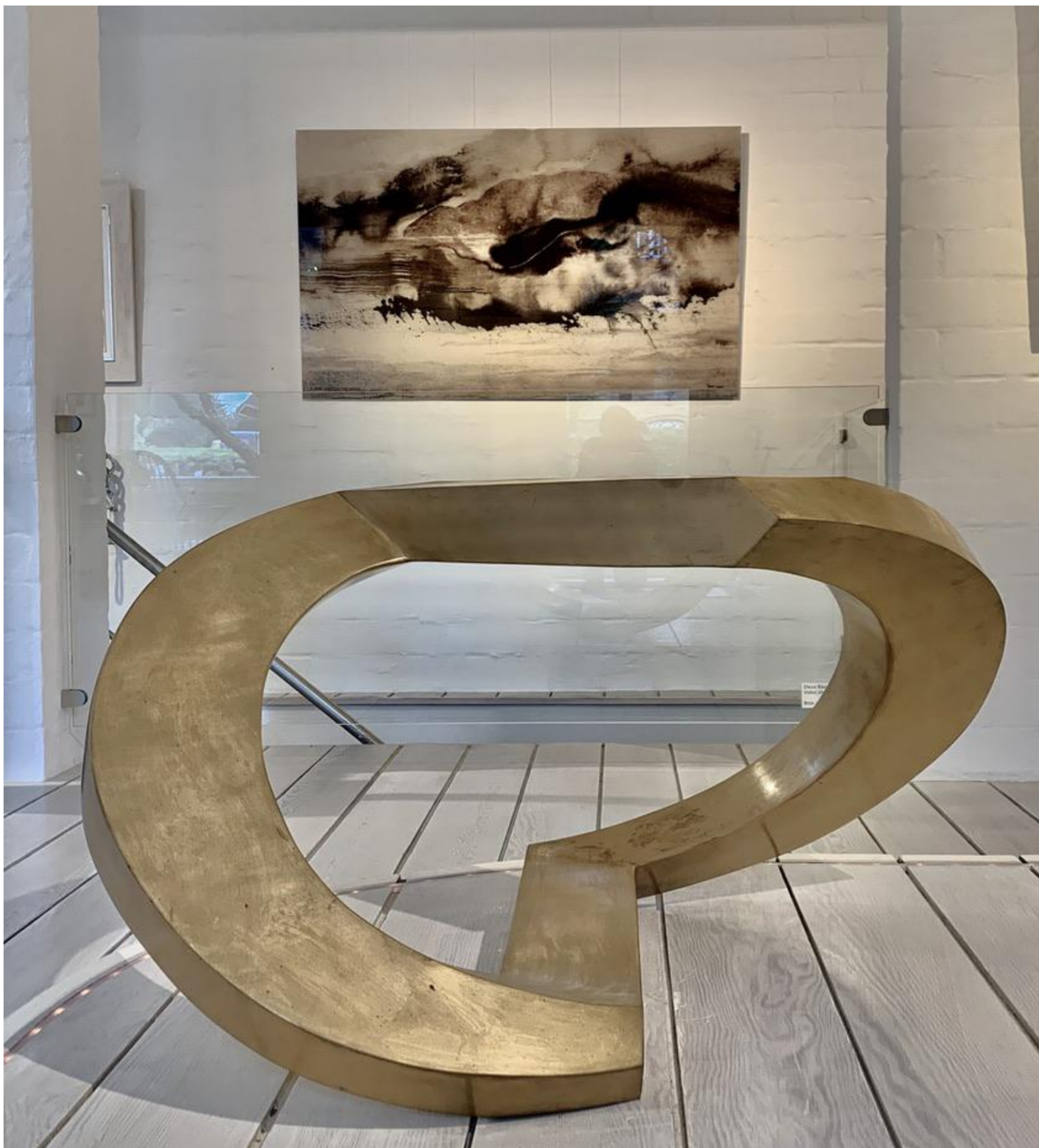
Maximilian Verhas - Große Raumschleife, 2005 Mattierte Bronze, 85 x 110 x 85 cm, © Maximilian Verhas & Galerie Falkenstern Fine Art