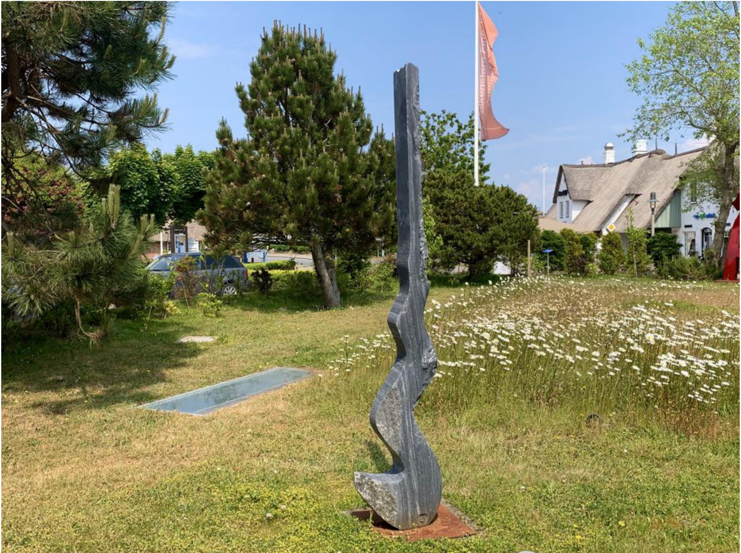
Thomas Reifferscheid - Windungen Vertikal, 2018

Wachauer Marmor aus Österreich, 197 x 37 x 16 cm, © Thomas Reifferscheidt & Galerie Falkenstern Fine Art