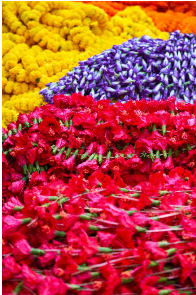
Dinesh Khanna - Kolkata April 19th II, 2019 C-Print, Auflage 40, © Dinesh Khanna & Galerie Falkenstern Fine Art