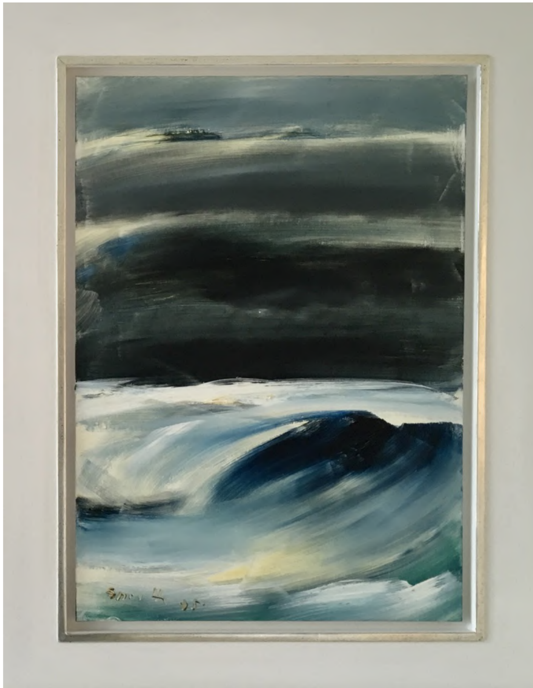
Siegward Sprotte - Gesicht einer Landschaft I, 1995 Öl auf Leinwand-Pappe, 70 x 50 cm, © Galerie Falkenstern Fine Art / Armin Sprotte