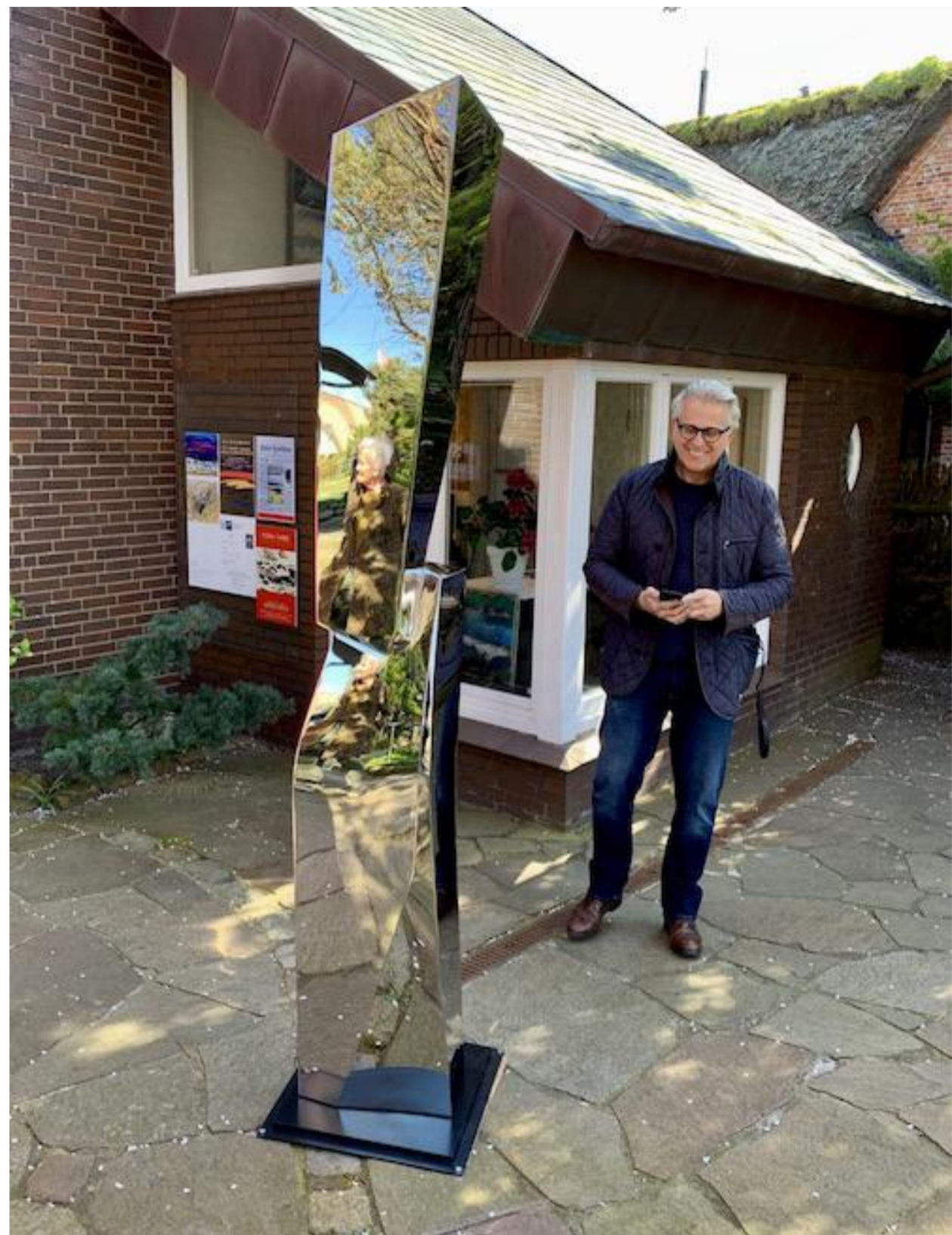
Stefan Faas: Anthropomir Kephalos II, 2019 Spiegelstahl V4a, Höhe 230 cm © Stefan Faas & Galerie Falkenstern Fine Art

Stefan Faas - Anthropomir Kephalos II, 2019 Mirror finish Steel V4a, Height 230 cm © Stefan Faas & Galerie Falkenstern Fine Art