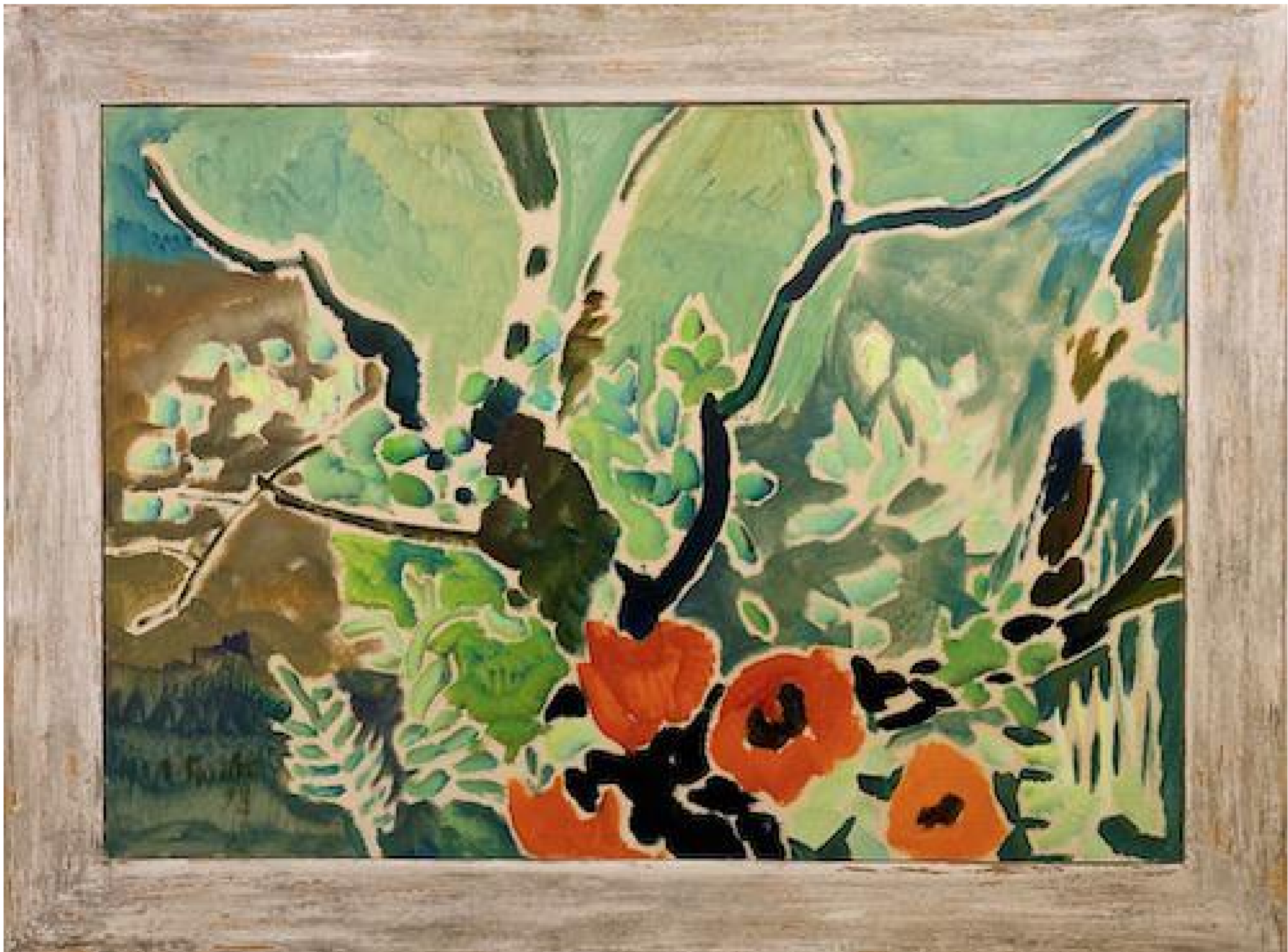
Siegward Sprotte - Wildnisgarten, 1998 Öl auf Karton, 69 x 99 cm, © Galerie Falkenstern Fine Art / Armin Sprotte