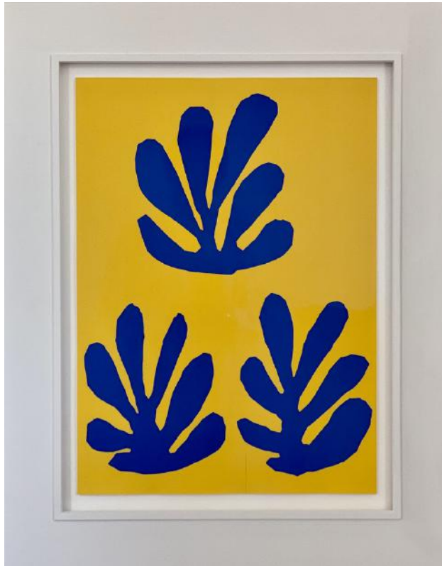
Henri Matisse – Sans Titre, 1951 Offsetlitho, 60 x 43,5 cm, © Galerie Falkenstern Fine Art / Armin Sprotte