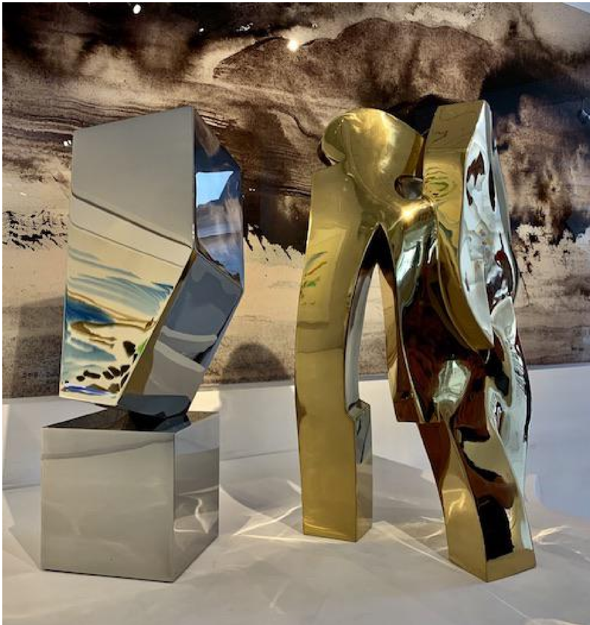
Stefan Faas - "Anthropomir Testa XX-V", 2019