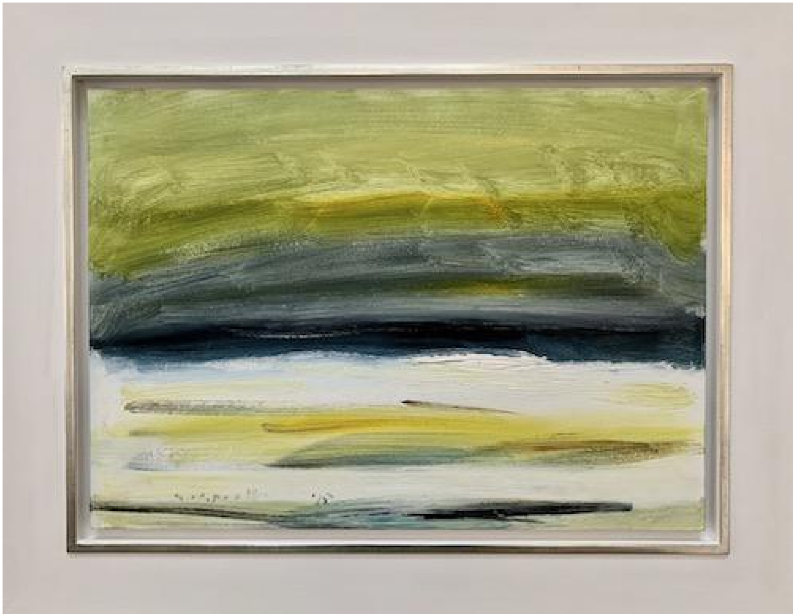
Siegward Sprotte - Gesicht einer Landschaft II, 1995 Öl auf Leinwand-Pappe, 50 x 70 cm, © Galerie Falkenstern Fine Art / Armin Sprotte