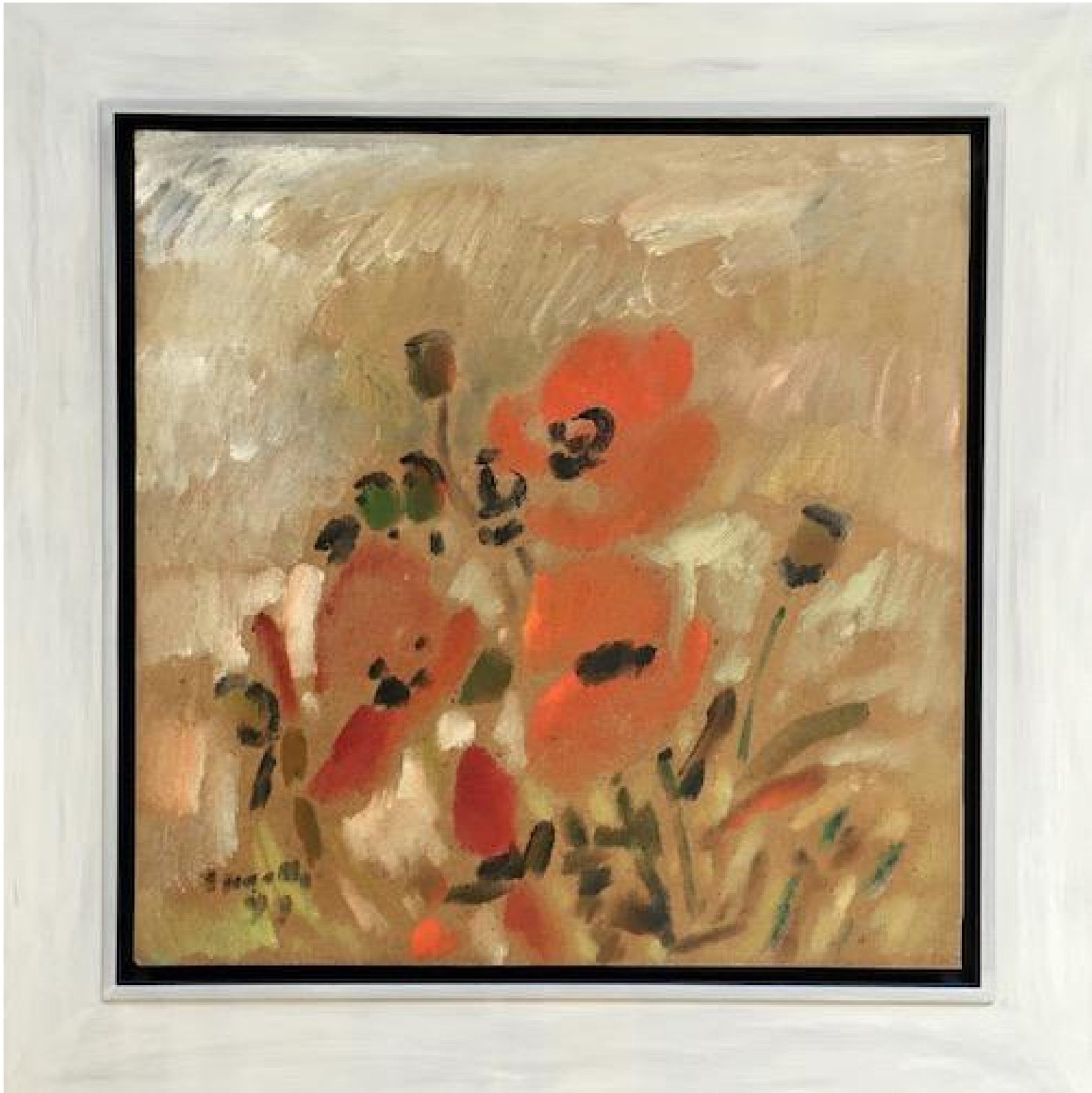
Siegward Sprotte - Mohn, 1999

Öl auf Hartfaser, 61 x 60,6 cm, © Galerie Falkenstern Fine Art / Armin Sprotte