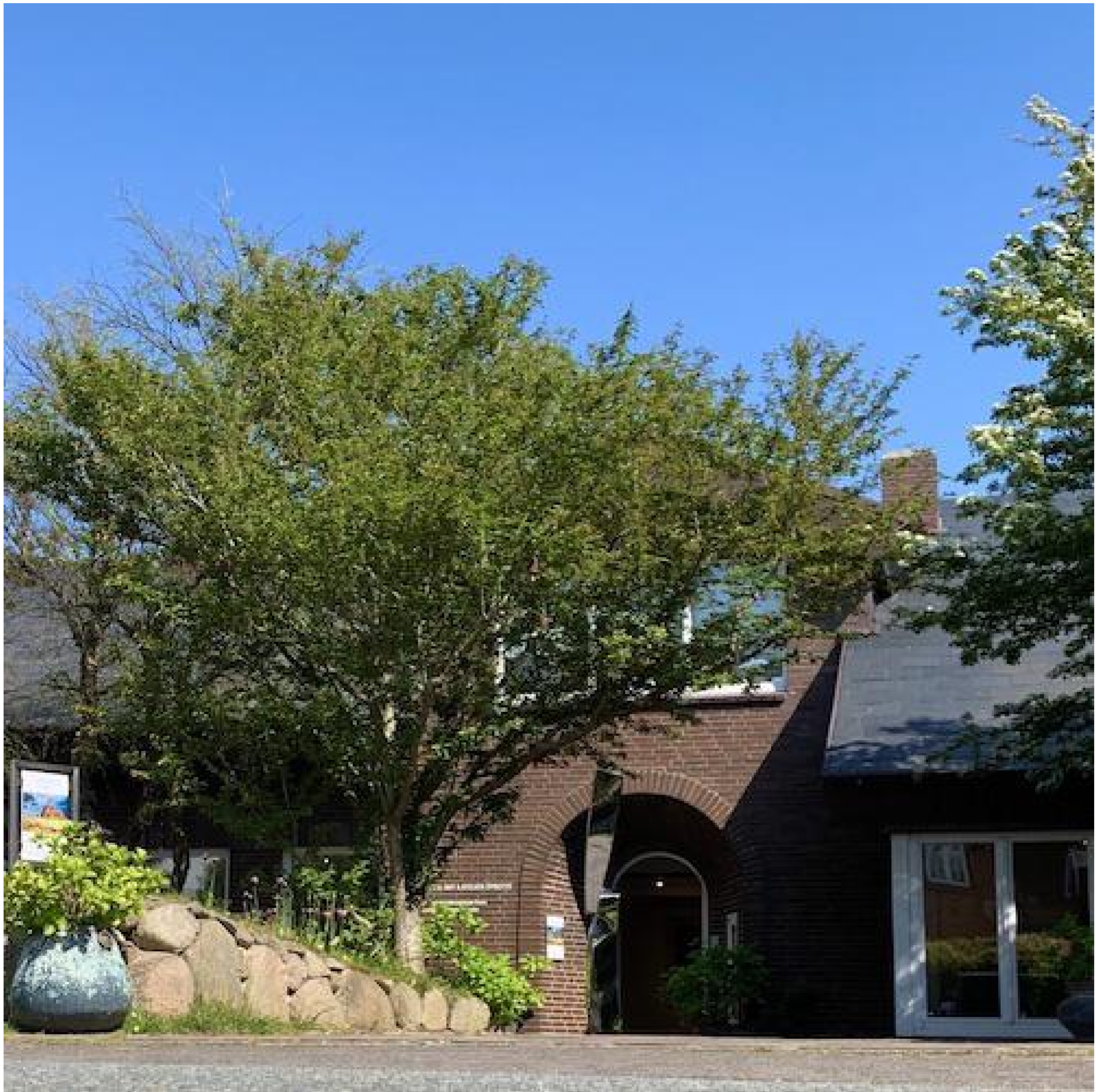
Galerie Falkenstern Fine Art, Kampen