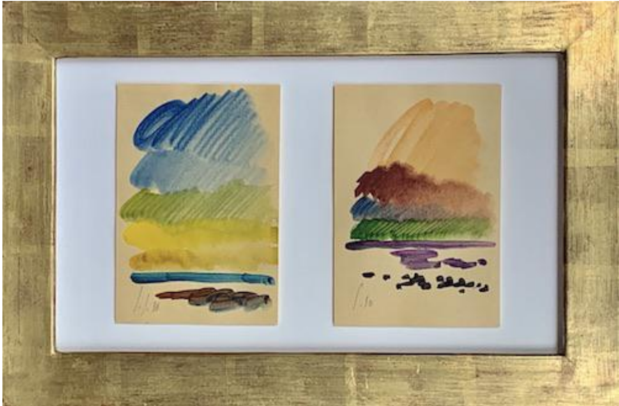
Siegward Sprotte - Zyklus Hohe Himmel Kampen, 1990 Aquarell auf Karton, je 15 x 10,2